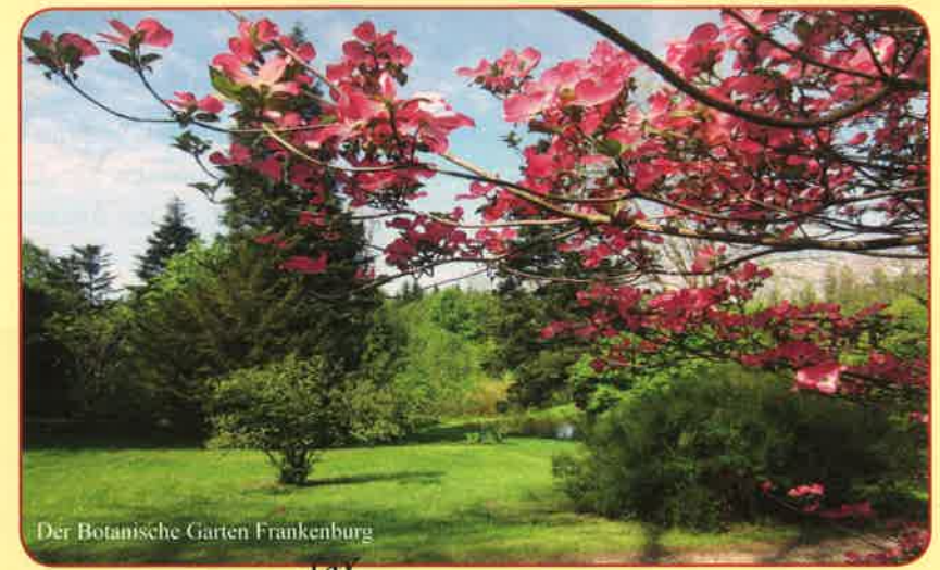
Der Botanische Garten Franckenburg

Wir öffnen wieder unsere Gartentüren für Sie!