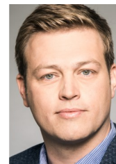
Stefan Kaineder Landesrat OÖ

Im Mittelpunkt des Sommerabends steht der gemütliche Austausch untereinander.